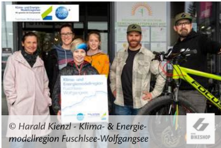
© Harald Kienzl - Klima- & Energie- modellregion Fuschlsee-Wolfgangsee